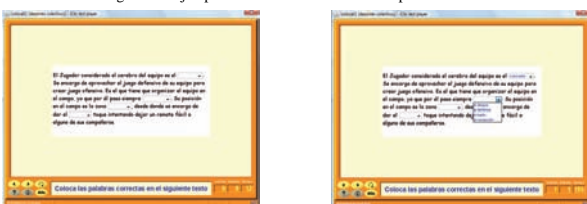
Figura 14. Ejemplo de actividad de texto de rellenar agujeros.

conocimiento. No obstante presentamos un par de ejemplos el primero de las actividades de respuesta escrita (figura 13) y el segundo de rellenar agujeros (figura 14). Estas constan de una tabla con varias celdillas y otra con una sola celdilla. En las celdas de la tabla presentamos las preguntas y, en la celdilla aislada tendremos que escribir la respuesta a dicha pregunta. La pregunta puede ser realizada de forma textual o con elementos multimedia. En la actividad que hemos diseñado como ejemplo, hemos planteado como pregunta escribir el nombre del deporte marcado en la tabla superior. Para resolverla se hace clic sobre una de las imágenes y se escribe el nombre en la celdilla que aparece en blanco en la parte inferior. La pregunta general se hace en el espacio reservado al mensaje inicial. En la imagen de la izquierda presentamos la actividad al inicio y en la de la izquierda a medio resolver (figura 13).