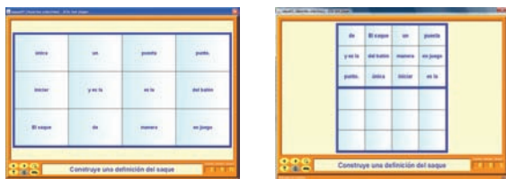
Figura 7. Ejemplo de combinación de un puzzle de intercambio y otro doble sobre voleibol.

Tanto los puzzles dobles como los de intercambio, pueden ser utilizados para la introducción de diferentes conceptos como pueden ser definiciones, normas, seriaciones, ... La introducción de las definiciones se realiza dividiéndolas en tantas partes como celdillas queramos que tenga la definición. Se transcribe a las celdillas y al ejecutar la actividad esta aparecerá desordenada teniendo que ser ordenada por el alumno. En la imagen siguiente presentamos una actividad en la que hay que construir la definición del saque en el voleibol. El ejemplo se ha realizado en primer lugar, utilizando un puzzle de intercambio y en segundo lugar usando un puzzle doble. En este, hay que trasladar las frases construyendo la definición a la segunda tabla (figura 7).