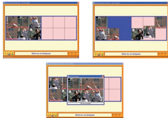
Figura 5. Ejemplo de un puzzle doble sobre voleibol

En los puzzles dobles (figura 5), en una parte de la pantalla se presenta la imagen desordenada y en la izquierda una pantalla en blanco con el mismo número de casillas para que se vayan trasladando las piezas hasta completar la imagen. Evidentemente, al aumentar el número de casillas la dificultad aumentará. Volvemos a presentar tres imágenes del puzzle, la primera al inicio de la actividad, la segunda con la actividad a medio hacer y la tercera con la pantalla de ayuda.