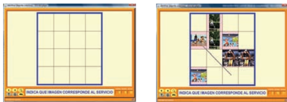
Figura 8. Ejemplo de actividad mediante un juego de memoria sobre voleibol.

Aunque se pueden emplear ambos tipos de puzzles, es preferible utilizar el puzzle de intercambio. La dificultad va a depender del número de casillas que tenga a más casillas más dificultad. También tenemos que indicar que estas actividades serían apropiadas para niveles con lectura comprensiva.