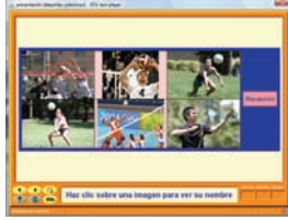
Figura 2. Ejemplo de una actividad de exploración deportiva sobre el voleibol.

sos. Al hacer clic sobre una parte de la primera imagen (columna vertebral) además de aparecer el nombre, se reproduce un archivo sonoro con dicho nombre. Indicar que las imágenes pueden tener cualquier formato gráfico o de texto y que en el ejemplo se clicó sobre «la columna vertebral» como muestra la imagen.