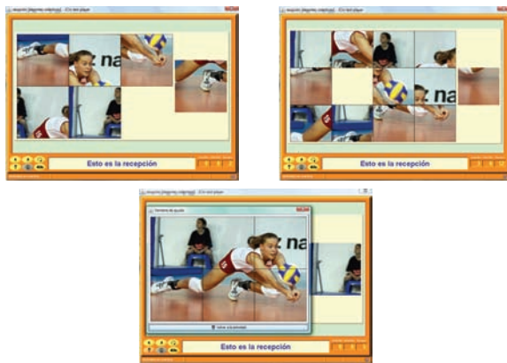
Figura 6. Ejemplo de un puzzle doble sobre voleibol

El sistema presenta una pantalla con las piezas desordenadas y extrayendo una al azar que coloca a la derecha del puzzle. Para resolverlo hay que desplazar las piezas utilizando el agujero. Al igual que en los casos anteriores, presentamos la actividad con seis, doce piezas y con el puzzle resuelto (pantalla de ayuda) El aumento del número de piezas incrementa la dificultad bastante más que en los tipos citados anteriormente. Dichas actividades se pueden observar en las imágenes adjuntas.