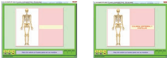
Figura 1. Ejemplo de actividades sobre conocimiento del cuerpo humano.