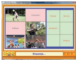
Figura 11. Ejemplo de actividad de emparejamiento o relación entre imágenes sobre voleibol.