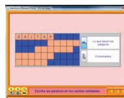
Figura 10. Ejemplo de crucigrama.

Especialmente interesantes son los crucigramas, aplicables en los últimos cursos de primaria o para la secundaria, aunque el sistema nos permite diseñar crucigramas elementales que puedan ser resueltos en los primeros cursos. En el ejemplo se propone un crucigrama de términos de deportes que se han debido trabajar a lo largo del proyecto. El crucigrama que se presenta está a medio resolver. El modo de resolverlo es situar el cursor en una casilla cualquiera del crucigrama y en la parte de la derecha aparecerán las definiciones de la línea horizontal y de la vertical. Es interesante indicar que las definiciones pueden ser textuales o con elementos multimedia, orales, gráficos o de video (figura 10).