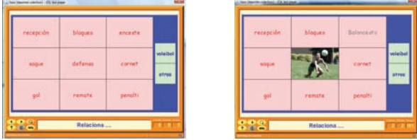
Figura 12. Ejemplo de actividad de emparejamiento o relación sobre voleibol.

ambos conjuntos (tablas o paneles) debe de ser el mismo (correspondencia biyectiva). En la imagen adjunta observamos una actividad de este tipo en la que tenemos que emparejar o relacionar cada imagen (acción del voleibol) con su nombre. El número de elementos de ambos conjuntos, acciones y nombres, tiene que ser el mismo. En el ejemplo, cuando se acierta con la asociación, en el lugar de la pieza del conjunto inicial aparece la palabra correcta. En el ejemplo de la figura adjunta hemos resuelto la imagen del colocador y de la defensa con su nombre, apareciendo este, en lugar de la imagen en el conjunto o panel inicial (figura 11).