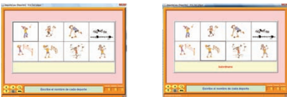
Figura 13. Ejemplo de actividad de texto de respuesta escrita.

Para terminar, indicar que Jclíc dispone de un tipo de actividades denominadas de texto y que a continuación relacionamos: de respuesta escrita, completar textos, rellenar agujeros, ordenar elementos e identificar elementos. Aunque pueden ser utilizadas en el diseño de actividades de Educación Física están pensadas principalmente para otras áreas de