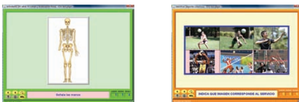
Figura 3. Ejemplo de gestos técnicos que se realizan con las manos en el voleibol.

Los puzzles son actividades muy indicadas para los primeros cursos de educación primaria ya que, la cantidad de información que se puede introducir es muy amplia y variada. Desde el punto de vista de la